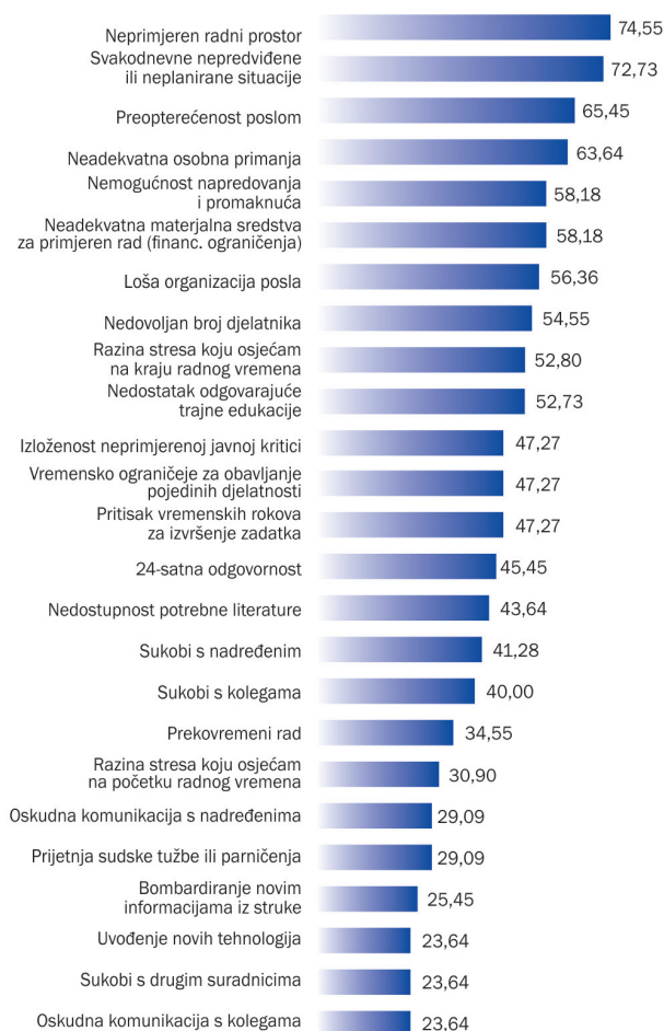
Grafikon 1. Stresni i izrazito stresni čimbenici kod zdravstvenih djelatnika

Za ispitivanje razlika u razini stresa između zdravstvenih i nezdravstvenih djelatnika korišten je t-test za nezavisne uzorke.