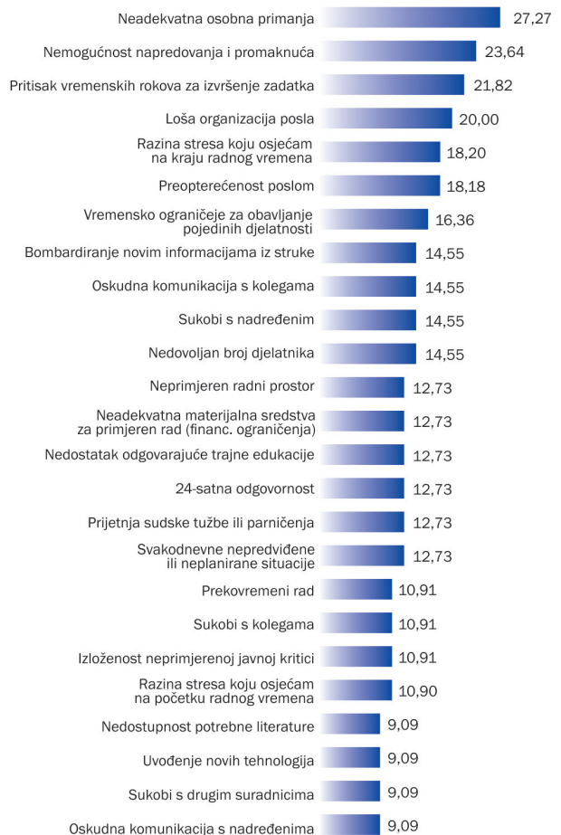
Grafikon 2. Stresni i izrazito stresni čimbenici kod nezdravstvenih djelatnika

U Tablici 1. prikazani su rezultati intenziteta stresa na Likertovoj skali kod zdravstvenih i nezdravstvenih djelatnika